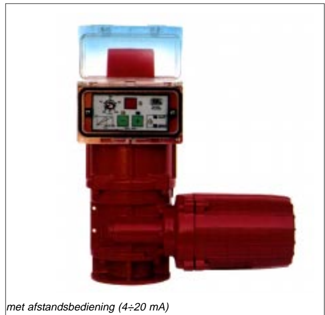
met afstandsbediening (4-20 mA)